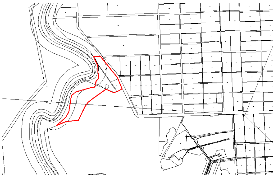
Рисунок 5 – Расположение участка на кадастровом плане территории

При подготовке схемы расположения образованного ЗУ используется кадастровый план территории (рис. 5).