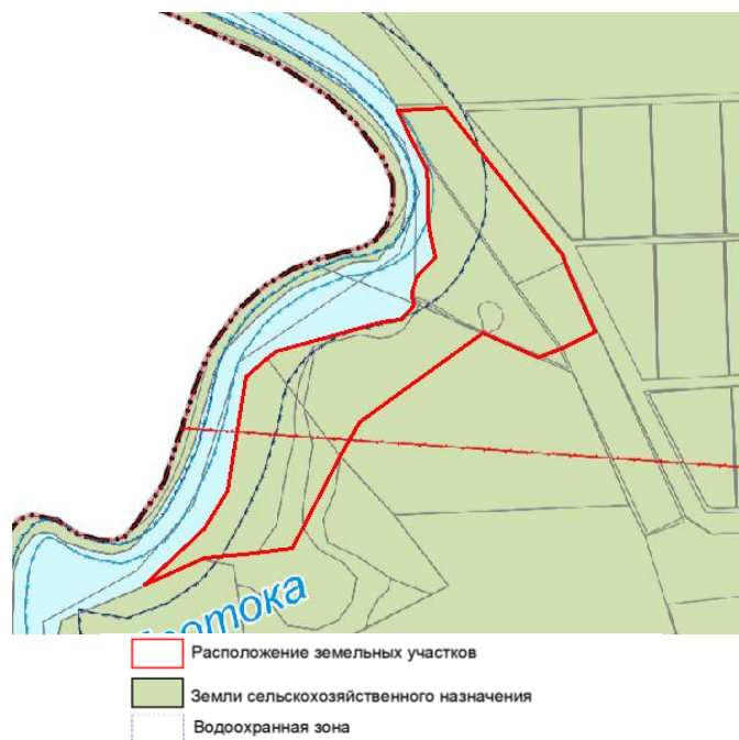
Рисунок 3 – Расположение земельных участков на генеральном плане Протичкинского сельского поселения Красноармейского района

Вовлечение земельного участка в оборот предусматривает экономическое обоснование его вовлечения, учитывая возможную прибыль и целесообразность [5].