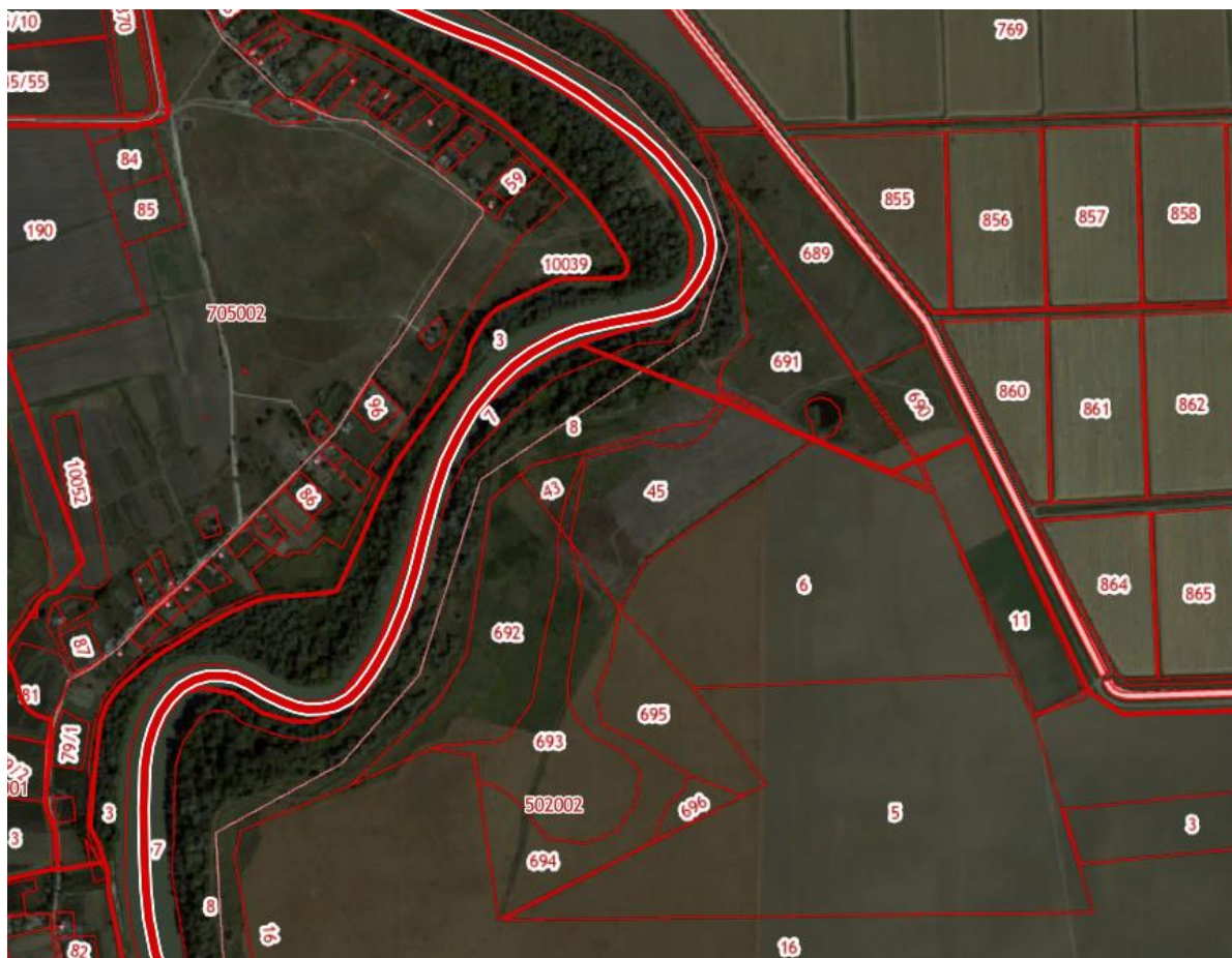
Рисунок 1 – Расположение выбранных земельных участков на публичной кадастровой карты

Данные земельные участки относятся к землям сельхозназначения, но при этом не используются. Они расположены в Протичкинском сельском поселении Красноармейского района.