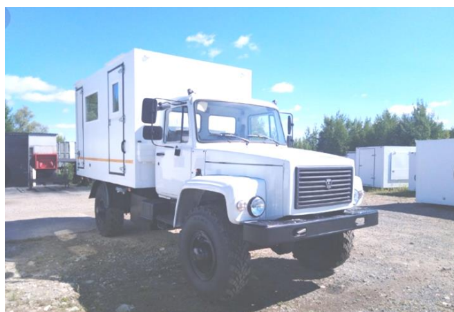
Рисунок 1 – Передвижная авторемонтная мастерская ПРМ ГАЗ-33081

Данная передвижная авторемонтная мастерская предназначена для определения технического состояния узлов и агрегатов с.-х техники при номерных технических обслуживаниях ТО-2, ТО-3, текущем ремонте ТР, периодическом техническом осмотре, а также для выявления и устранения причин неисправностей и отказов тракторов (рисунок 1).