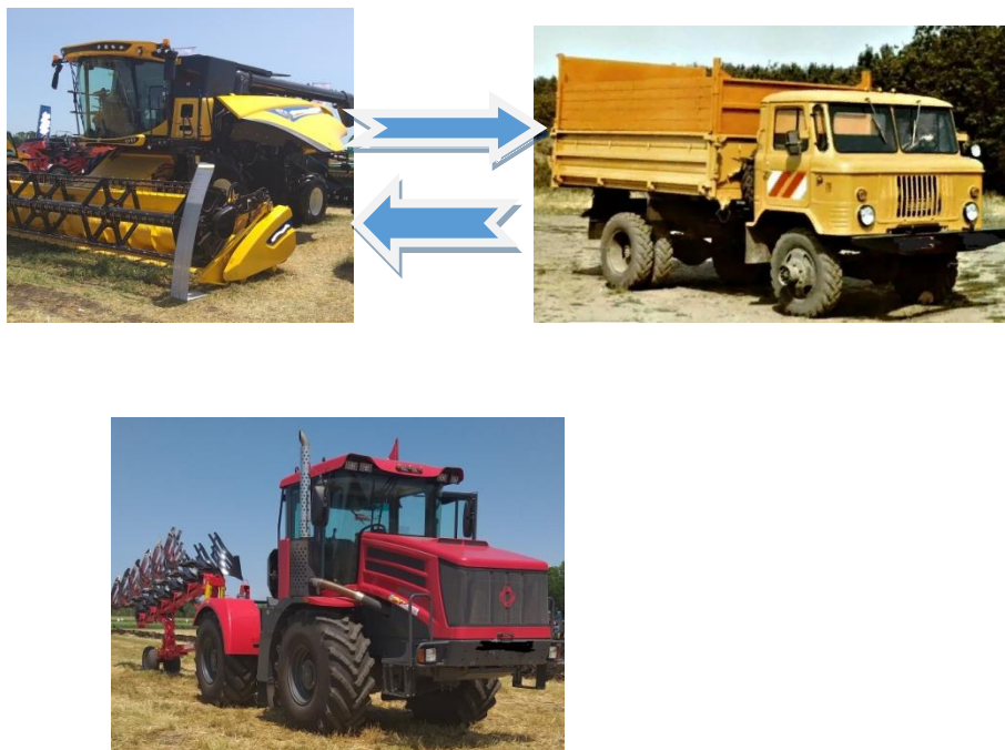
Рисунок 2 – Элементы подсистемы уборки, имеющие атрибуты

Элементы рассматриваемой системы имеют свойства или атрибуты. Например, трактор, зерноуборочный комбайн, транспортное средство имеет технико-экономические показатели, технические характеристики: производительность, расход топлива, скорость движения, число оборотов, массу, геометрические размеры (рис. 2).