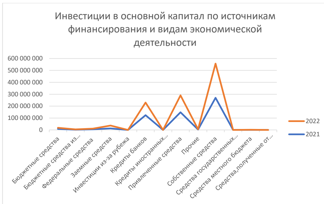
Рисунок 1. Инвестиции в основной капитал по источникам финансирования

Изучение природы появления новых денежных масс в АПК показало факт доступности, как и в других отраслях, трех типов инвестиций – государственные субсидии, займы и кредиты банков и частные вложения. Для России характерно, как видно по отраженным на рисунке 1 данным [1] Федеральной служба государственной статистики, преобладание именно частных инвестиций над банковскими кредитами, что объясняется прежде всего возможностью крупных предприятий возвращать в оборот значительную часть выручки. Отдельно отметим, ещё одну особенность рынка сельскохозяйственной продукции, выявленную в ходе исследования, а именно значительное различие в соотношениях рентабельности и доле выручки от общей прибыли у одиночных предприятий и у агропромышленных концернов. Так, при одинаковой средней доходности, представитель среднего бизнеса может не получать почти никакой финансовой пользы от своего предприятия, тогда как более крупное предприятие способно удерживать 15-20% заработанных на операциях