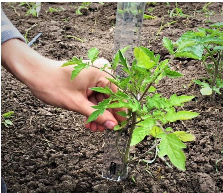
Рисунок 2 – Учеты высоты растений томата на опытном участке (сорт Аделина, 10 май 2022 г.)

В процессе исследований проводили фенологические учеты от посева до уборки плодов томата; биометрические показатели роста и развития растений (рисунок 2). Во время уборки с каждой делянки отдельно проводили сбор и учет (с 25 июня 2022 года по 17 августа 2022 г.).