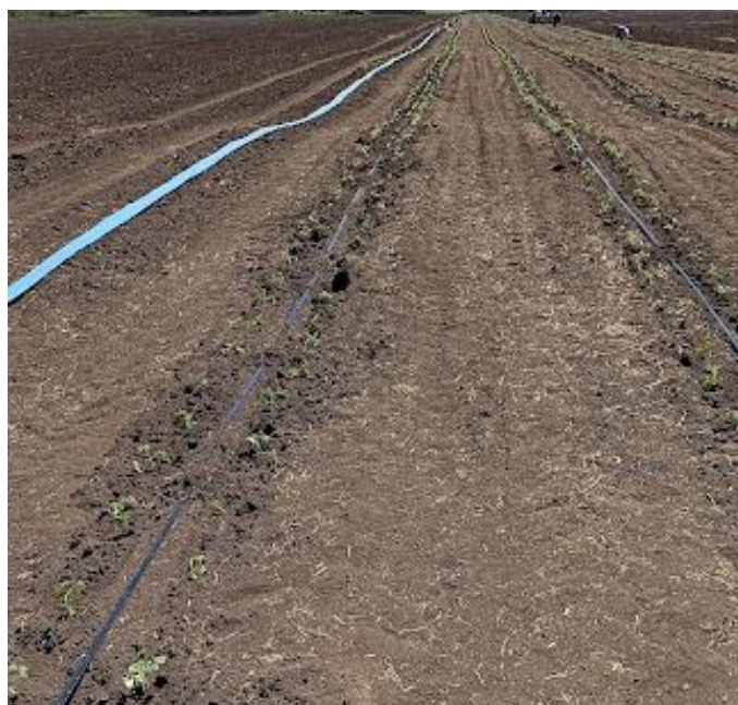
Рисунок 1 – Высадка рассады на опытном участке

В течение вегетации для поддержания водно-воздушного режима почвы проводили междурядные культивации на глубину 8-10 см. Против вредителей и болезней опрыскивали посадки томата инсектицидами, разрешенными для использования на территории РФ.