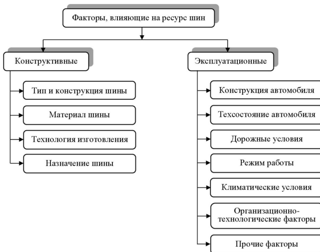
Рисунок - 1. Факторы, обуславливающие износ шин

Зависимости износа покрышек от пробега присуще крайне непростое очертание, а скорость их износа во многом находится в зависимости от наработки: